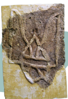
Цеглина з тризубом із Десятинної церкви