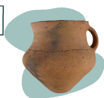
Глечик трипільських часів