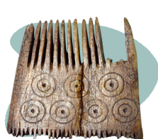
Кістяний гребінець часів Святослава