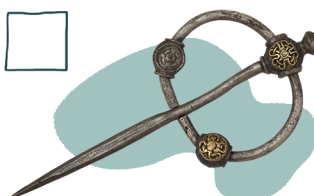
Фібула – застібка для плаща княжого воїна