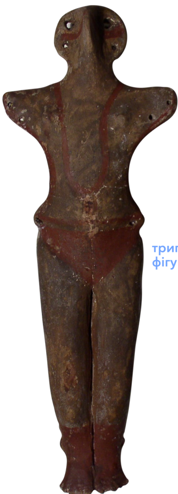
трипільська фігурка 1

Домалюй фігурці те, чого ще, на твою думку, не вистачає.