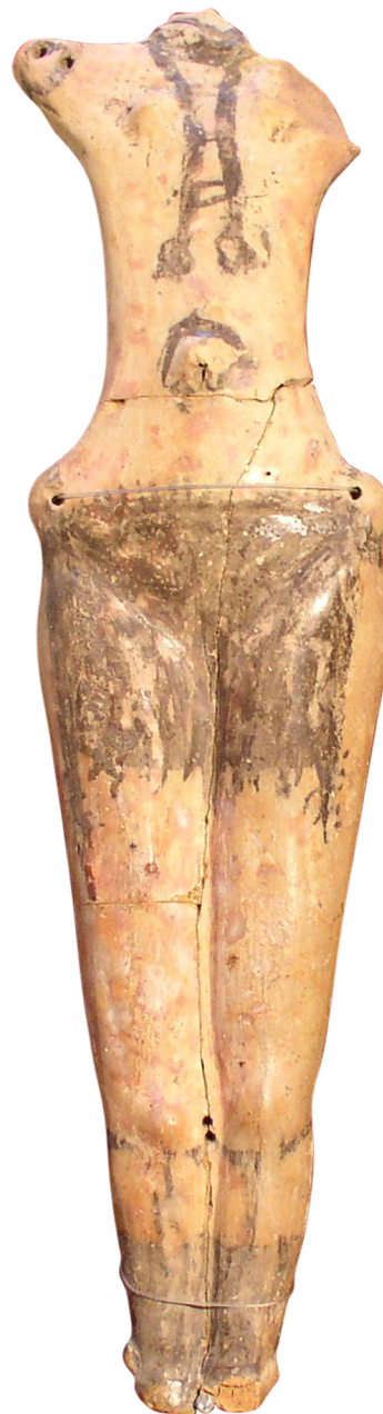
трипільська фігурка 2

Увиразни розписи на скульптурі: намисто, тканину на стегнах, взуття, малюнки навколо пупця (бодіарт).