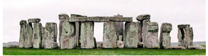
Стоунгендж. Вік: 50 століть.