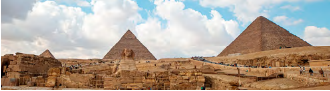
Піраміди. Вік: понад 45 століть.