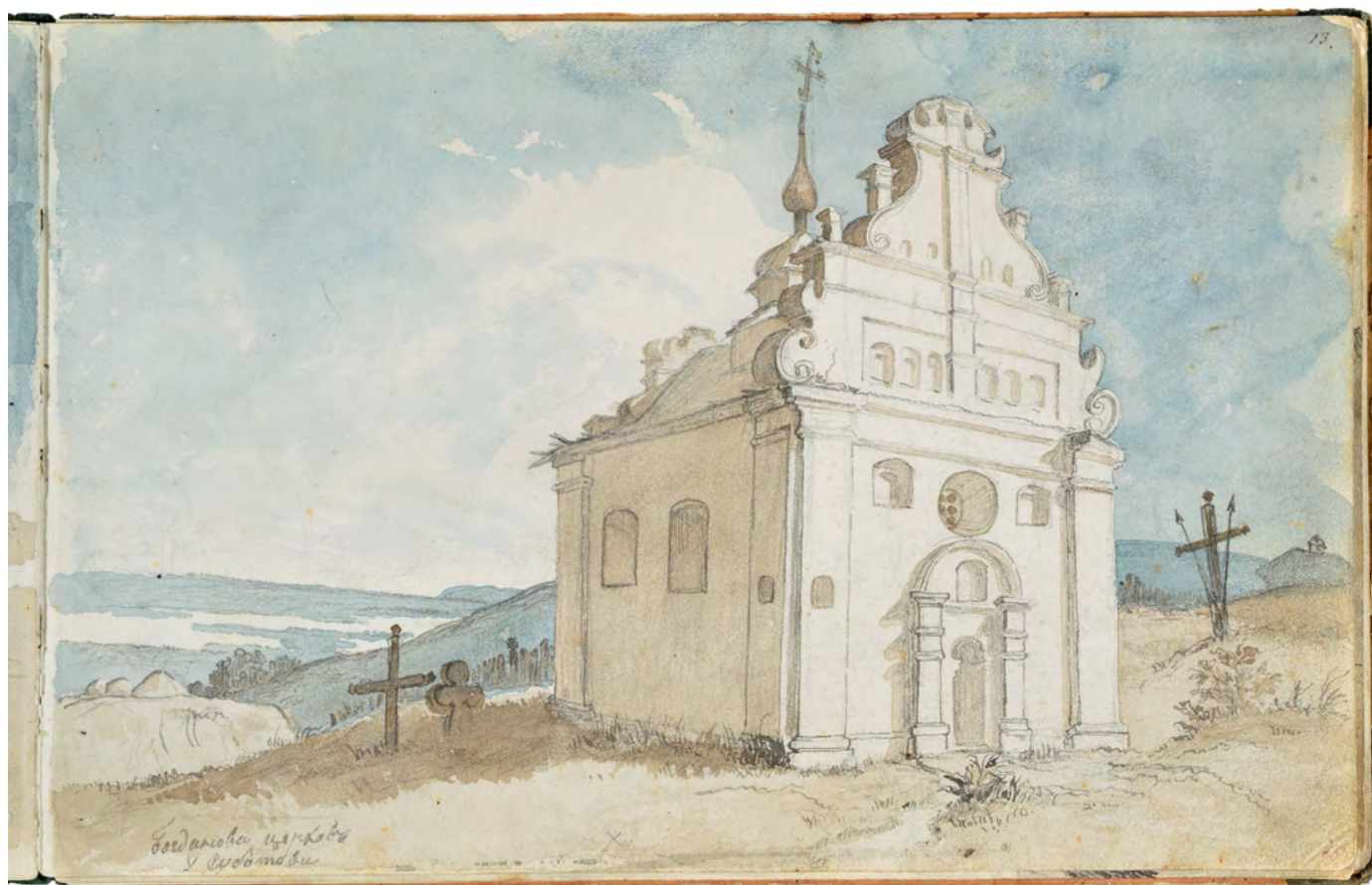
Тарас Шевченко, «Богданова церква у Суботіві»

Іллінська церква в селі Суботів була збудована Богданом Хмельницьким як храм для його родини. Самого гетьмана теж поховали там. Церкву малювали багато художників.