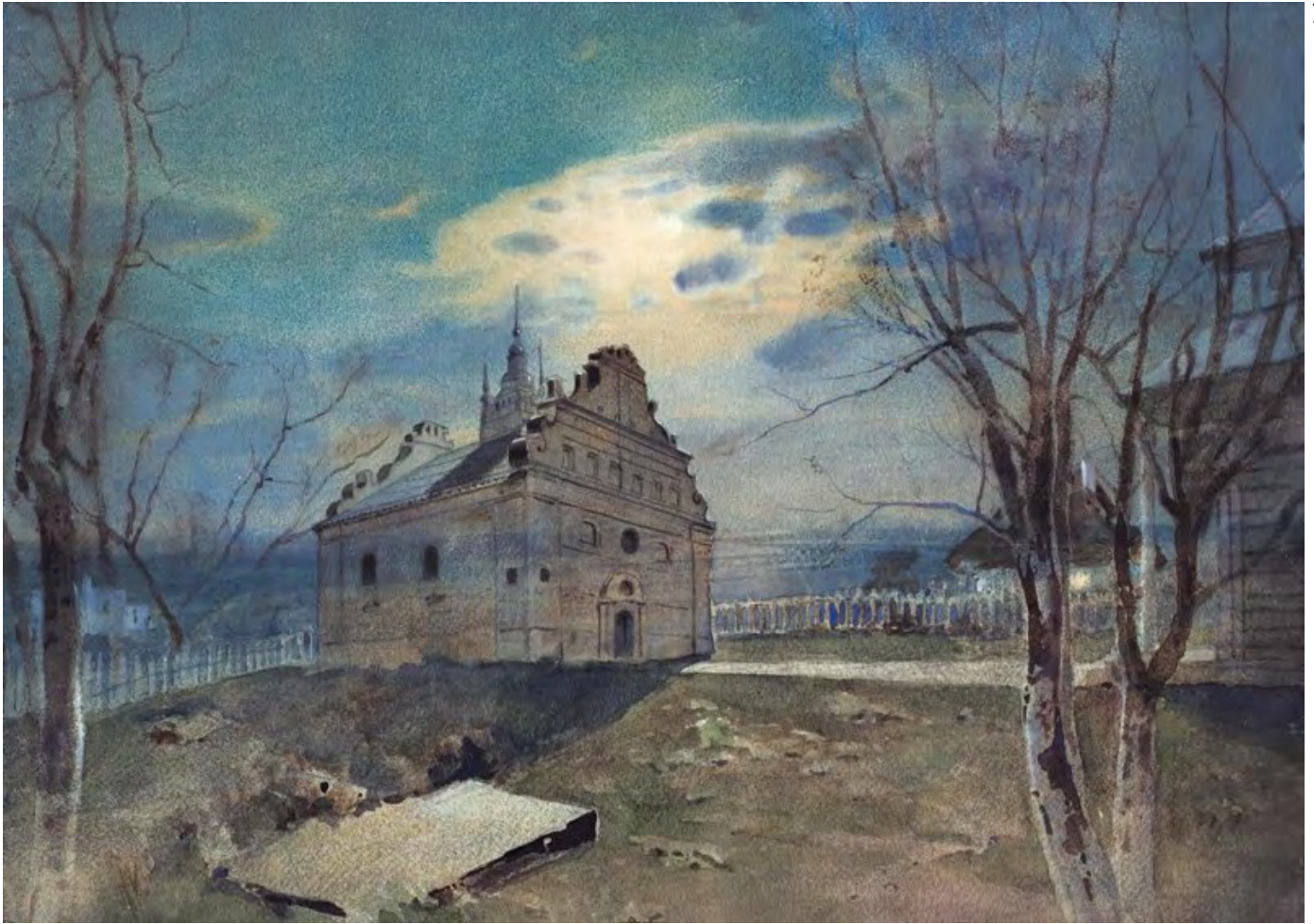
Сергій Васильківський, Св. Іллі в с. Суботів. Із серії «Типи українських церков»