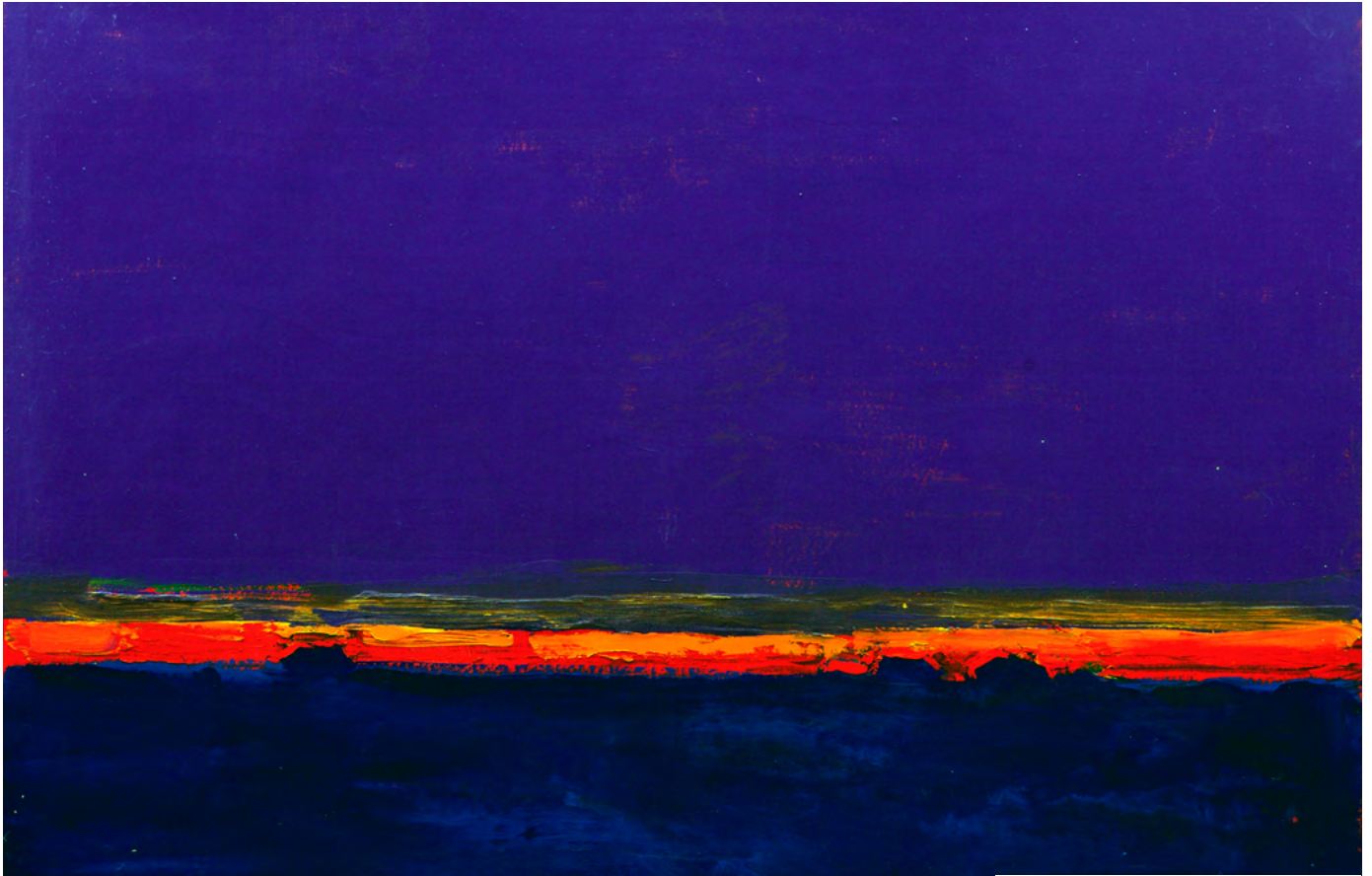
Анатолій Криволап, «Степ»

Обери пору дня або ночі та намалюй степ . Що ти бачиш? Що ти чуєш у цю пору? Що відчуваєш?