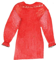
коротка сукня з довгим рукавом

Розглянь, чи видно Оленчині руки й ноги. З трьох суконь вибери таку ж, як в Оленки, та обведи її.