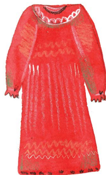
довга сукня з довгим рукавом