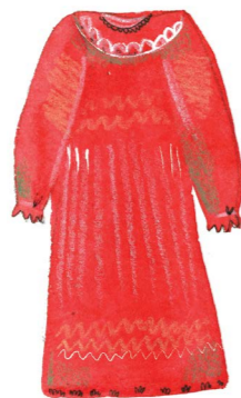
довга сукня з довгим рукавом