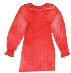
коротка сукня з довгим рукавом