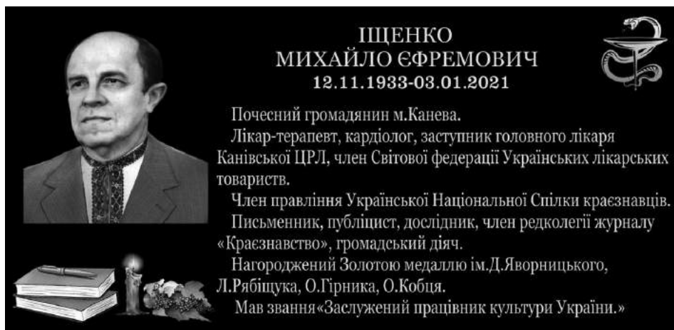
Фото проєкт-макету меморіальної дошки, яку буде встановлено на фасаді Канівської міської лікарні.

Володимир Іщенко, Канів, грудень 2022 р.